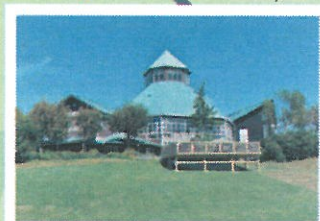
道の駅とみうら 枇杷倶楽部